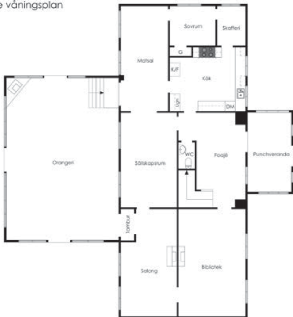
Herrgårdsvilla Nedre våningsplan